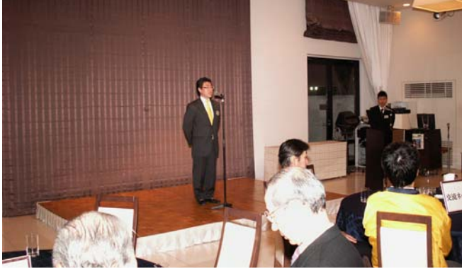
「今年も楽しくハジケましょう！！」