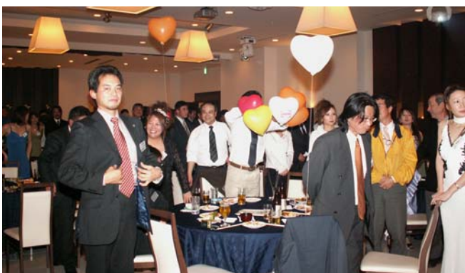
中締め前に襟を正して