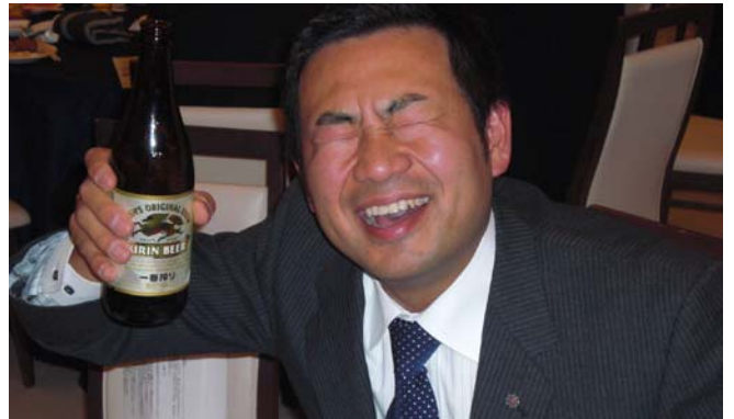
※注 米原ですけど・・・なにか？