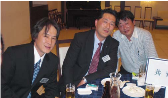
エロ男爵（真ん中の人）？