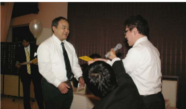
交流ネット 有終の美！！