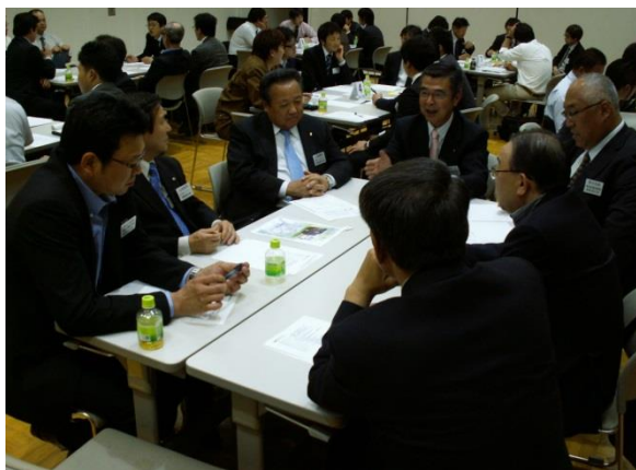
バズセッションの様子