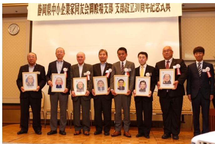
式典で感謝状と記念品を授与された歴代支部長の皆様